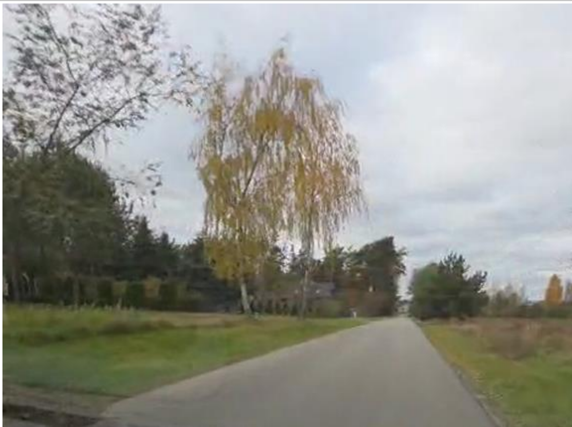
Zdjęcie nr 1. Widok na istniejącą drogę gminną w m. Sitnik, początek odcinka 2.

W okolicy drogi gminnej są następujące uzbrojenia techniczne: sieć energetyczna, sieć teletechniczna. Istniejące drzewa 13 szt. –przeznaczone do wycinki.